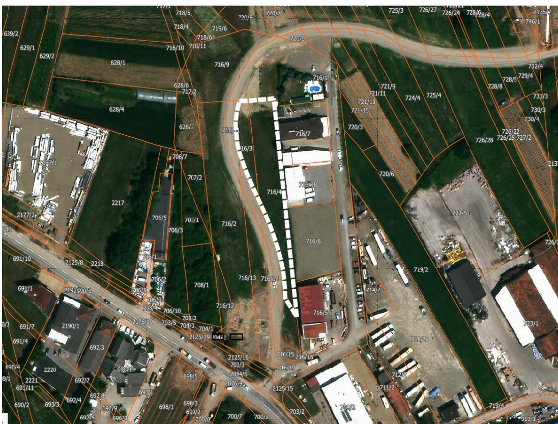
Граница обухвата Измене и допуне плана