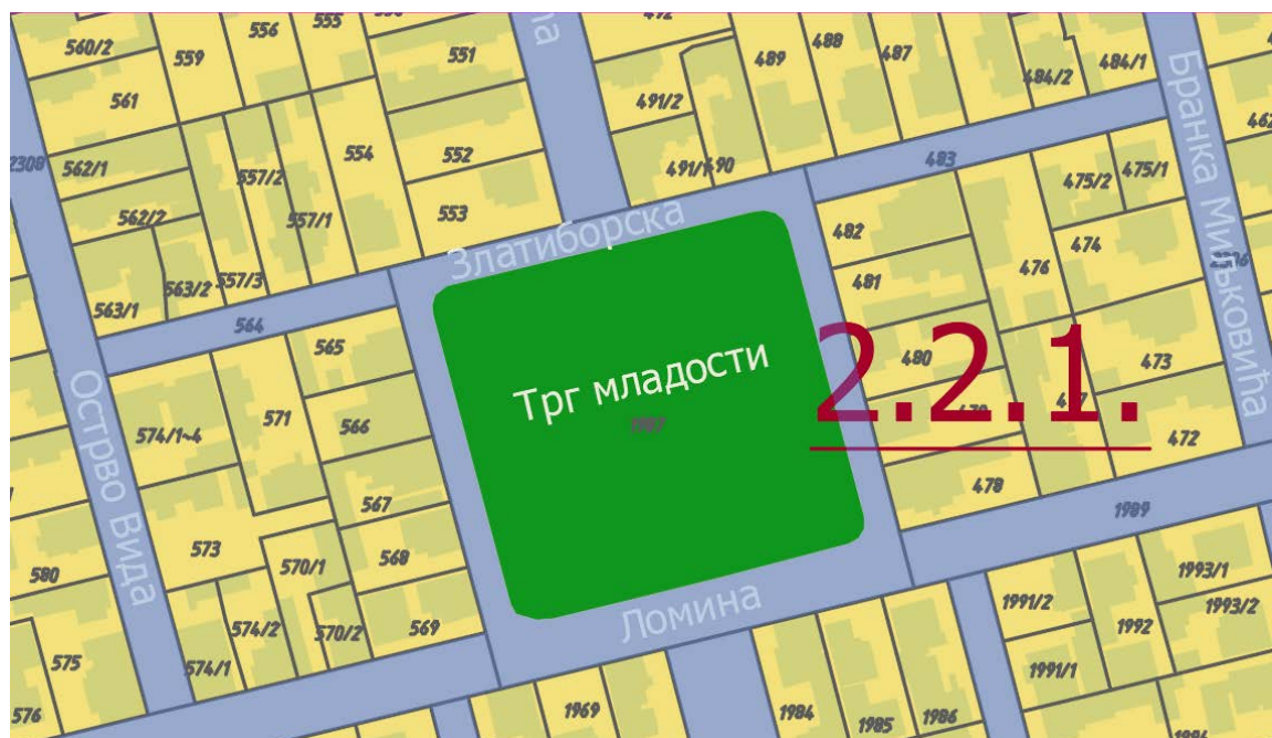
Лист бр. 2 – Планирана претежна намена површина

Исправка се односи на све графичке прилоге, али суштински утиче на следеће, који су овде и приказани, тако да у овом делу графичких прилога исти изгледају како следи: